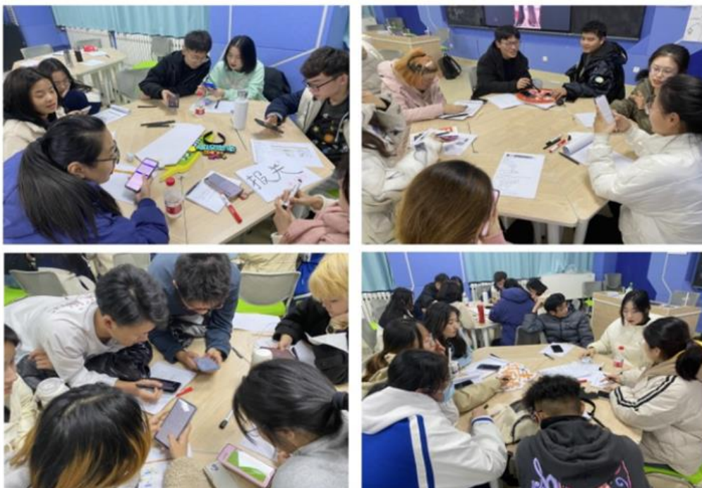
深夜：学生仍在讨论文案设计

“大爷，能麻烦您稍微晚一会再锁门吗？我们还需要再过一会才能把事情做完。”深夜11:30，山东女子学院经济学院的学生为了能把直播文案做的更完美一些，不得不请求实验楼物业管理工作人员晚一会锁门。这是最近一段时间几乎每晚都会发生的一幕，有的学生甚至申请晚上住在实验室。