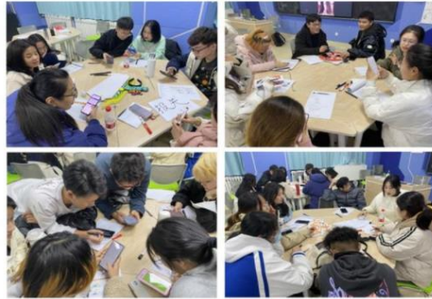
深夜：学生仍在讨论文案设计

“大爷，能麻烦您稍微晚一会再锁门吗？我们还需要再过一会才能把事情做完。”深夜11:30，山东女子学院经济学院的学生为了能把直播文案做的更完美一些，不得不请求实验楼物业管理人员晚一会锁门。这是最近一段时间几乎每晚都会发生的一幕，有的学生甚至申请晚上住在实验室。