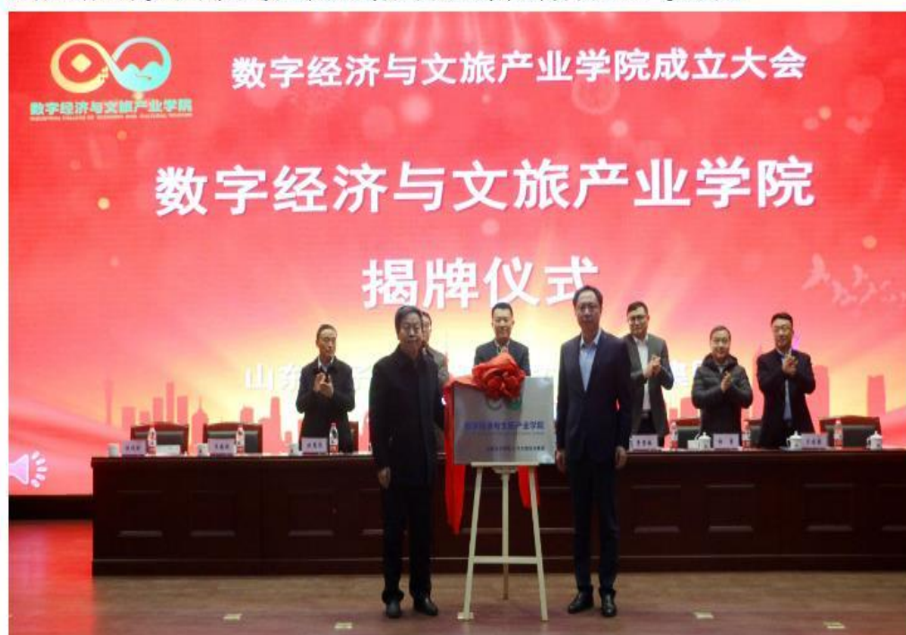
数字经济与文旅产业学院揭牌

近日，山东女子学院与山东文旅投资集团共建数字经济与文旅产业学院成立大会正式召开，这标志着山东女子学院在校企协同培养应用型经济人才方向上进一步深化。