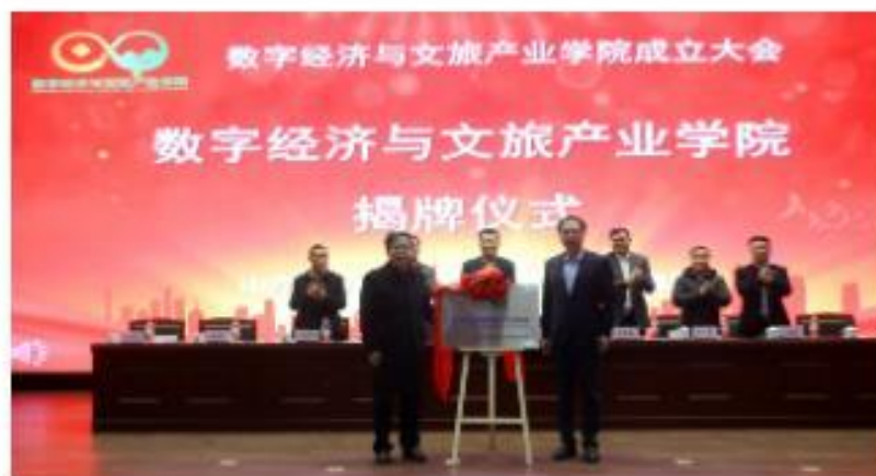
数字经济与文旅产业学院揭牌

近日，山东女子学院与山东文旅投资集团共建数字经济与文旅产业学院成立大会召开，标志着山东女子学院在校企协同培养应用型经济人才方向上进一步迈进。